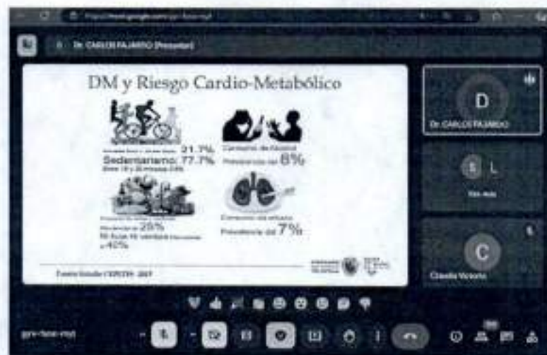
Evidencia fotográfica asistencia capacitación virtual